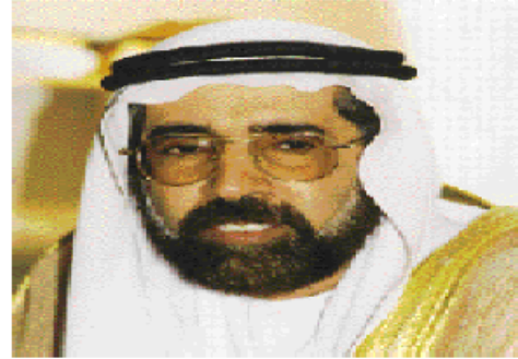
هيبد بن سيف الناصري

أعلن صبيد بن سيف الناصري وزير النفط والتروة المعدنية ان دولة الإمارات ستشارك في أي زيادة إنتاجية تقررها منظمة الدول للنفط «أوبك» وأن أي قرار بزيادة الإنتاج يجب أن يكون جماعياً داخل المنظمة. وبعث الناصري الأوضح في الأسواق العالمية مع صلي رودريجيز رئيس أوبك وزير الطاقة والطاقم القطري الذي أكد بدوره أنه ليس هناك حاجة لعقد اجتماع طارئ لـأوبك وان اهتمام المنظمة بالنسب على المحافظة على استقرار السوق وان أوبك على استعداد لزيادة إنتاجها التقضي إذا ما كان هذا ضرورياً للحفاظ على استقرار السوق.