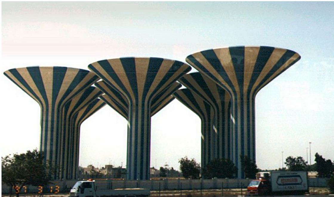
Kuwait Water Towers