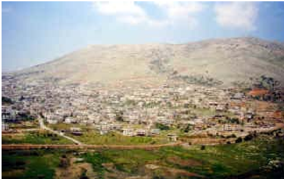
Golan Heights, Syria