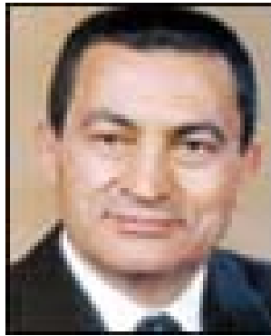
Mohammed Hosni Mubarak Current President of Egypt