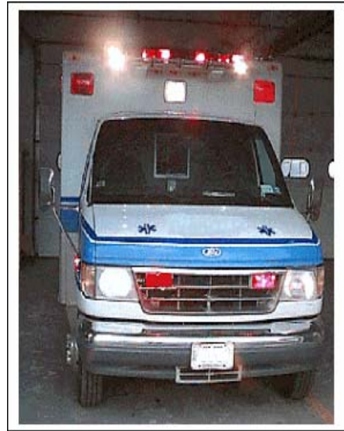
طوارئ طبية Medical Emergencies